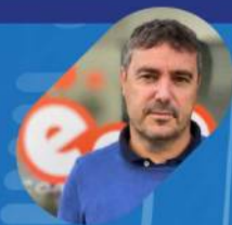
A cura di Tommaso Alati